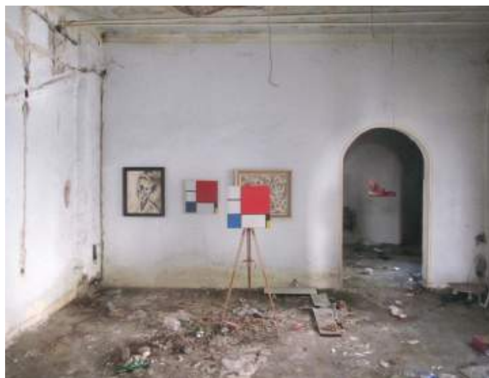
→ 7. Goran Đorđević „Kako kopirati Mondrijana“, obnovljeno sećanje, napuštena fabrika, Zemun 2021.