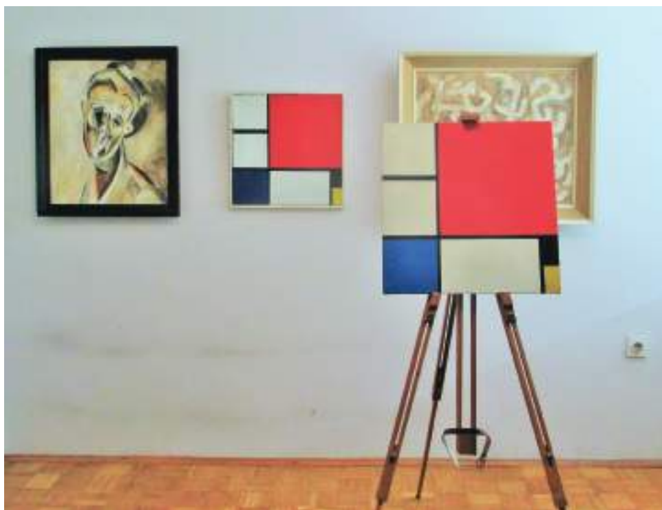
→ 6. Goran Đorđević „Kako kopirati Mondrijana“, obnovljeno sećanje, privatni stan, Beograd 2021.

Fondacija CURE u Sarajevu je organizovala osmomartovski marš pod parolom „Feminizam nije vodio ratove, nacionalizam jeste!“.