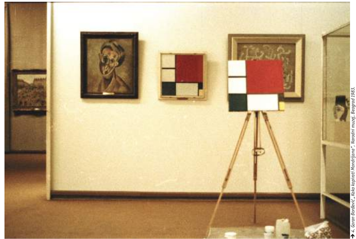
➔ 4. Goran Đorđević, „Kako kopirati Mondrijana“, Narodni muzej, Beograd 1983.