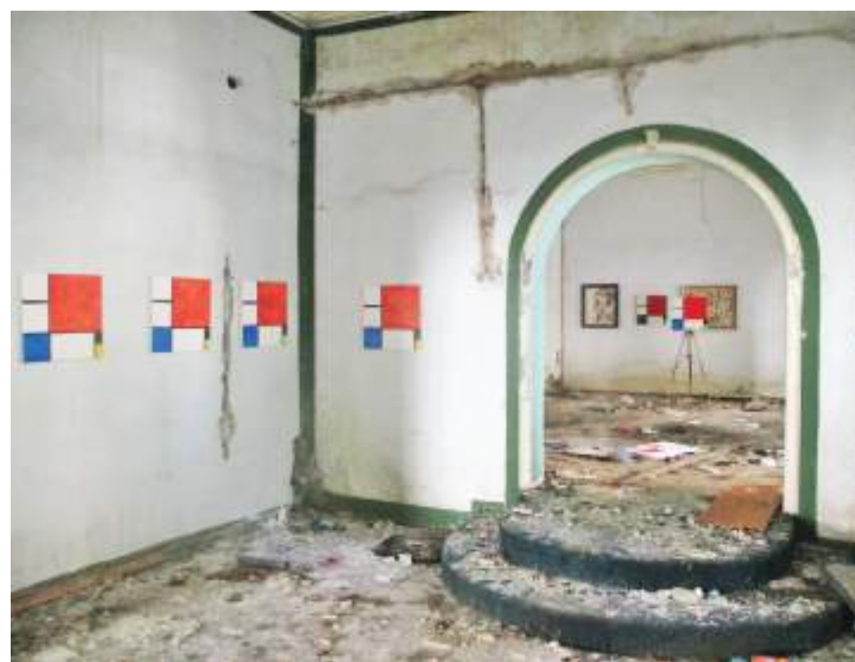
→ 8. Goran Đorđević „Sećanja na jednog Mondrijana“, napuštena fabrika, Zemun 2021.