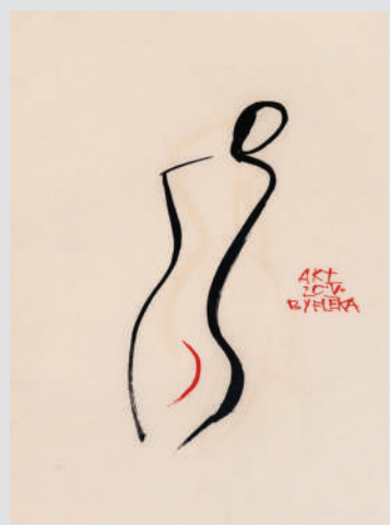
↑ Miomir Grujić Fleka: Akt by Fleka

Kao kompleksan poduhvat predstavljanja značaja Miomira Grujića – Fleke, izložba u Salonu MSUB je fokusirana na njegov kratkoročni opus vizuelnog umetnika, koji je manje poznat javnosti, ali svakako uključuje druge interdisciplinarnе segmente, izuzetno