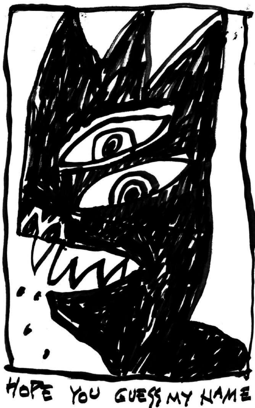
→ Miomir Grujić Fleka

je ovaj nacionalni park u kategoriju zaštićenih područja od međunarodnog i nacionalnog, odnosno izuzetnog značaja. Biodiverzitet Fruške gore je izuzetno bogat i od neprocenjive vrednosti. Nacionalnim parkom dominiraju šume lipe, hrasta i bukve, a posebno su značajne šume kitnjaka i graba. Obod fruškogorskog lesnog platoa prekriva stepska vegetacija bogata retkim i reliktnim vrstama. Na području planine registrovano je ukupno 1500 biljnih vrsta, od čega preko 200 biljaka spada u grupu zaštićenih vrsta. Ono što Frušku goru izdvaja u odnosu na druge planine Srbije jeste postojanje preko 30 različitih vrsta orhideja, od čega 18 vrsta ima međunarodni značaj. Životinjski svet je takođe izuzetno raznolik. Oko 60 vrsta sisara naseljava ove šume. Od 13 vrsta vodozemaca i 11 vrsta gmizavaca, 14 vrsta se nalazi na Svetskoj crvenoj listi ugroženih vrsta . Na području nacionalnog parka registrovano je 211 vrsta ptica od čega se 130 gnezdi upravu to – što ga čini jednim