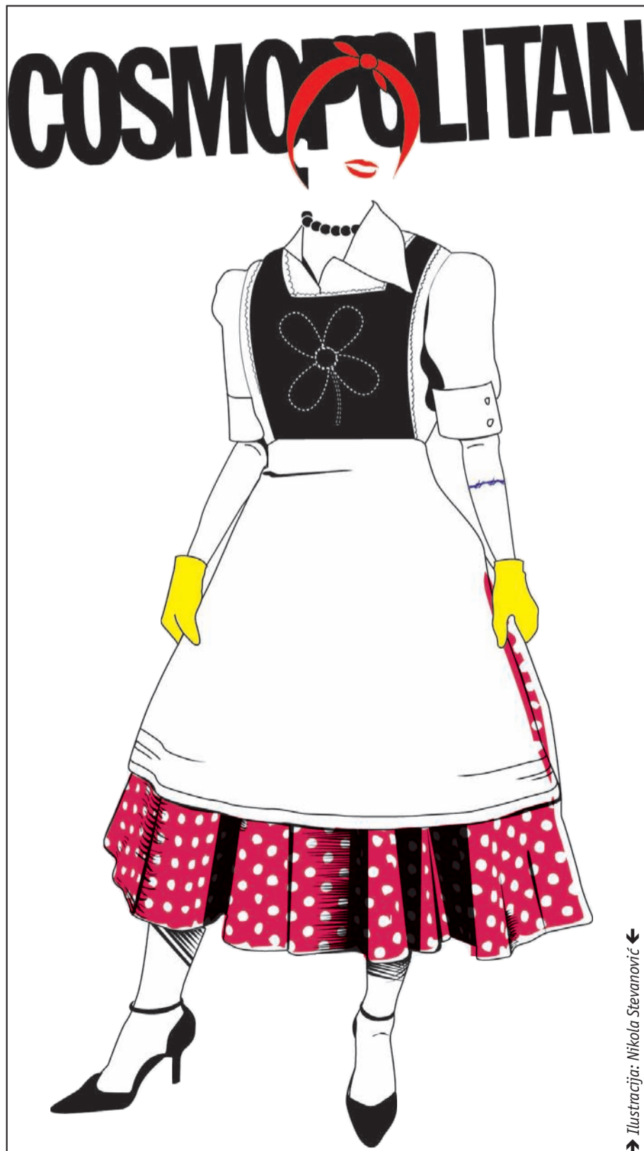
Ilustracija: Nikola Stevanović

Kada su krajem šezdesetih godina Amerikanke bacale lažne trepavice, papilotne, visoke potpetice i časopise poput Ladies Home Journal (LHJ) i Playboy u kantu slobode, one su nanele poslednji udarac toj viktorskoj predstavi o emancipovanoj ženi. Feministkinje drugog talasa su ovim gestom želele da pokažu da je nemoguće dobiti traženu ravnopravnost ukoliko seksualnost, a to implicira i dvostruke polne standarde, ne postane stvar o kojoj se govori. Pitanje doživljaja, predstavljanja i iskušavanja ženske seksualnosti tako postaje ključno pitanje feminističkog pokreta, koje više nikada neće moći da se stavi na margine, niti da se prikriva drugim „relevantnijim“ pitanjima. Od kraja šezdesetih, prvo iznimno, a potom sve otvorenije i nedvosmislenije počinje da se priča o piluli, o orgazmu, o klitoris, o pravu na uživanje u seksu u braku i van njega. Time se ide-