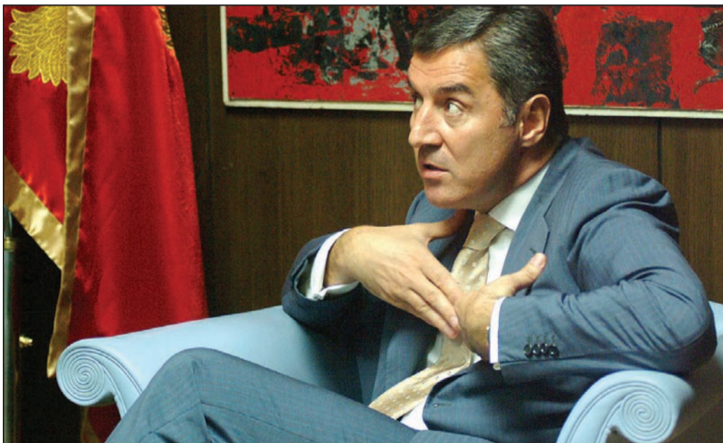
Mene? Šta ima mene da hvataju?

Lidera PZP-a su u njegovoj plemenitoj misiji međunacionalnog pomirenja, čisto iz higijenskih razloga, najprije stali napuštati glasači. Koji su mislili da ono „promjene“ iz naziva partije znači nešto nešto drugo, a ne Crnu Goru kojom će, za promjenu, vladati crnogorski klonovi Srpske radikalne stranke. Pa se broj ljudi koji glasaju za PZP, kako su pokazali lokalni izbori u Kotoru, nekoliko puta smanjio. Zatim su ga nastupile stranačke kolege: potpredsjednik PZP-a Goran Batričević povukao je za sobom veliki broj stranačkih funkcionera, poslanika i članova, pa osnovao Demokratski centar. Stoga se Medojević očajnički bacio u lobiranje za bilo kakvu takozvanu „zajedničku opozicionu listu“. Važno je samo jedno: