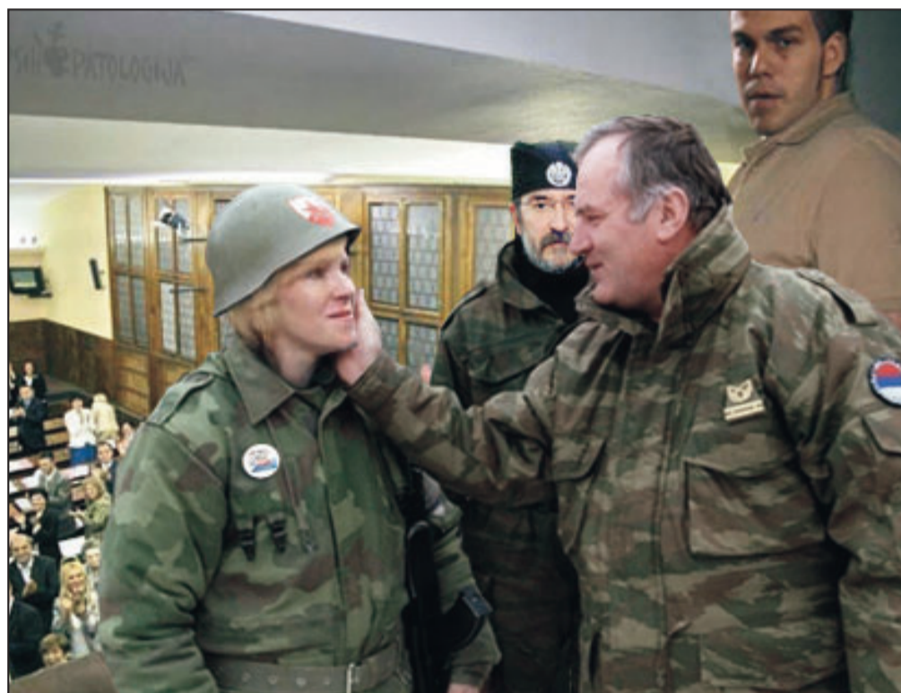
Fotomontaža: Hattori (Parapsihopatologija)