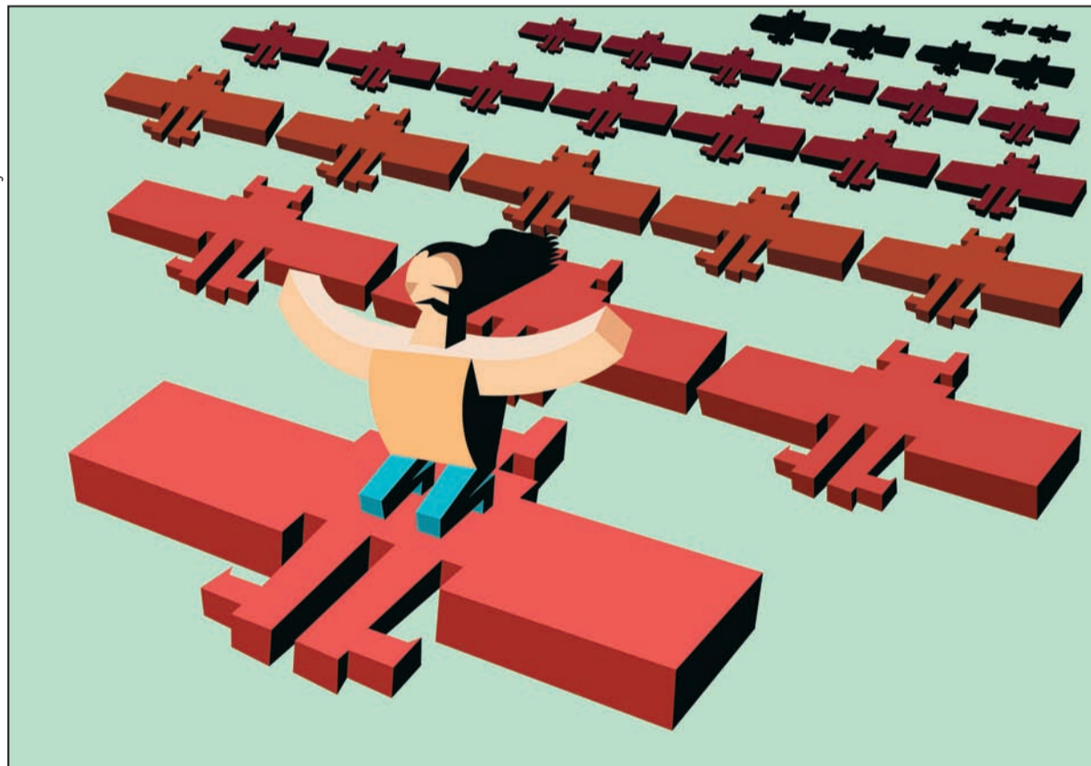
↑ Lazar Bodroža: Marko Kraljević - čuvar manastira ↓

takvog odnosa prema zločinu nije samo mogućnost da se on ponovi ili ne ponovi, već da se zločin svakodnevno živi tako da oni kroz koje se taj proces odvija toga ostanu u potpunosti nesvesni. Jer, redukovati politički problem na problem svesti, pogotovo nacionalne svesti, znači istovremeno zanemariti upravo one faktore koji su uzrokovali rat, nasilje i poniženja, a koji i danas nastavljaju da se reprodukuju.