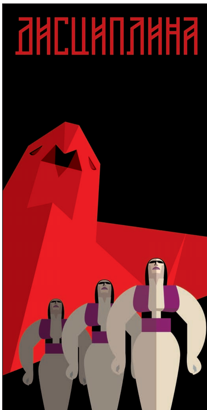
→ Ilustracije u broju su integralni deo projekta ZAKON Lazara Bodrože ←

Kroz svoju ontologizaciju političkog, Kordić se pridružuje onom načinu mišljenja koje na Miloševića i njegovu pogibeljnu vlast