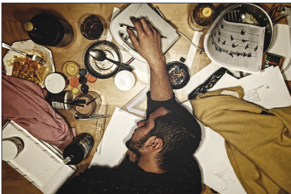
→ Fotografije u broju su delo mladih umetnika iz Prištine i Beograda, sa zajedničkog projekta Face The Reflection ←

Sve ovo ne znači da su ovi pokreti u svom stilu strogi, striktno okrenuti cilju, ozbiljni i namrgođeni. Međutim, taj udio veselosti u otporu nije u sva tri slučaja isti. Dok su studentske blokade prštale idejama i dobrim raspoloženjem, dotle su antivladine šetnje najogorčenije, s najmanje ustupaka samozadovoljstvu. Najviše cool bile su demonstracije u Varšavskoj, oko tog gradskog cilja uspjelo se pridobiti najviše javnih, umjetničkih, kulturnih i medijski istaknutih ličnosti. Opinion makerima najsu-