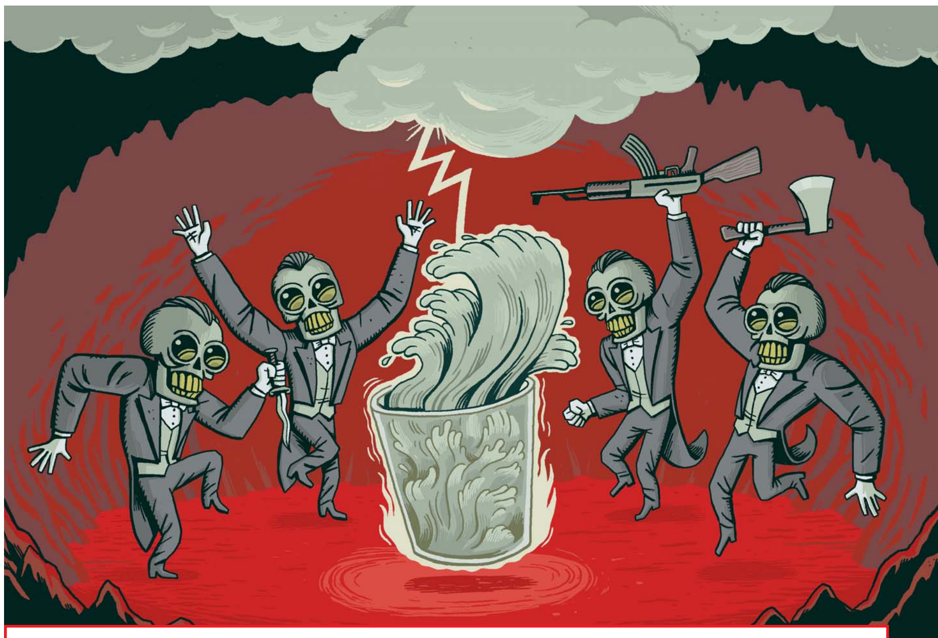
Ilustracija: Nikola Korac

Hteo bih da dam nekom drugom Da slušam šta će drugi da misli šta će da priča kome će da piše Hteo bih da ga predam neko drugom Da gledam kako drugi barata tišinom i psokama i čime se igra Na papiru Po kom su crtali tihi antibarbarusi Nacrtnim osmehom odgovarali na zadah tame odozdo Smešno ali neophodno