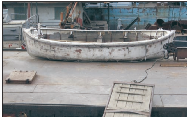
A šta ako je i on probušen

Došao doktor veselih nauka, pa kaže: - Tako mi grešnika, otpadnika i vere, biografija je kriva - zabranjujem mu da je pere! - Da li mu verujete?