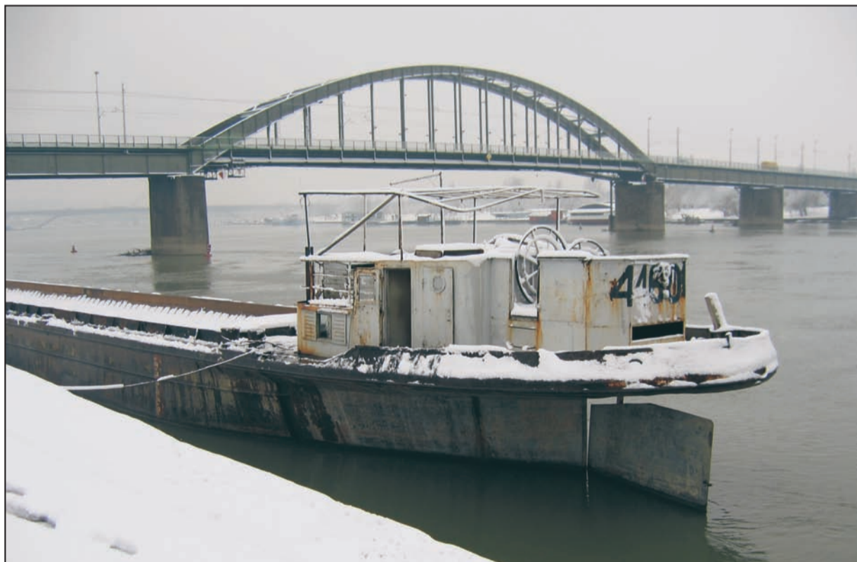
Lanjski snegovi saosećanja i pravde

Godišnjica početka sarajevskog pakla došla je neposredno posle justifikovanja još jedne sramote Srbije, presude Međunarodnog