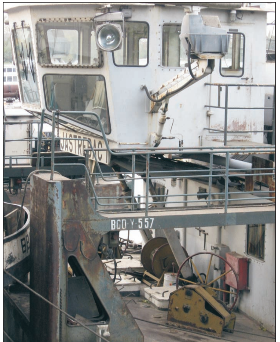
Jastrebac – Parnas u jednom pravcu

bitne vrline ovog romana. Krenimo korak dalje i upitajmo se: koja je njihova funkcija? Da li čine Kolekciju dobrim romanom? Odgovor je vrlo jednostavan: ne služe (skoro) ničemu, a Kolekciju ni enciklopedijsko obrazovanje autora ne bi moglo učiniti boljim delom.