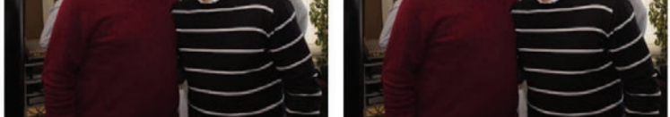
By Aleksandar Sapic (@AcASapic)